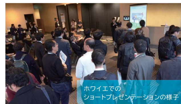
ハワイエでのショートプレゼンテーションの様子

プログラムの合間の休憩時間や一部BoFの時間帯に関しては、飲食物のご提供や、展示ブース・書籍販売コーナーなどで、協賛企業の皆様にご協力いただきました。飲み物やお菓子を片手にホッと一息ついたり、よりリラックスして意見・情報交換ができた方も多かったのではないのでしょうか。