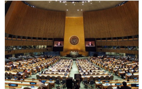
UNGA WSIS+10 High Level Meeting